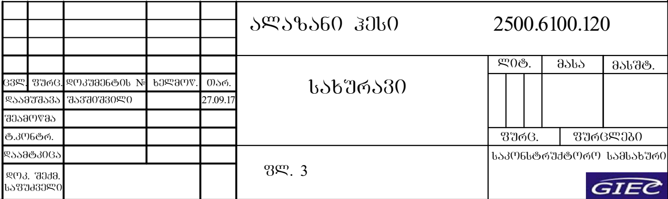
რეზ 1 ცალი