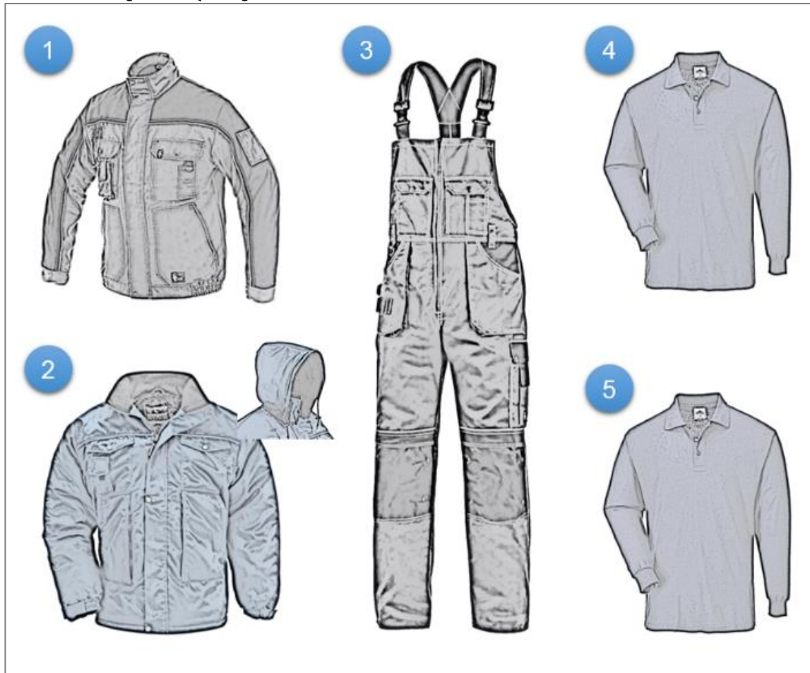
სურათი 1: საწარმოო პერსონალის ზამთრის სპეცტანსაცმლის კომპლექტი:

(1) ქურთუკი; (2) დათბუნებული კაპიუშონიანი წყალგაუმტარი ქურთუკი; (3) კომბინეზონი; (4)(5) გრძელსახელიანი მაისური;