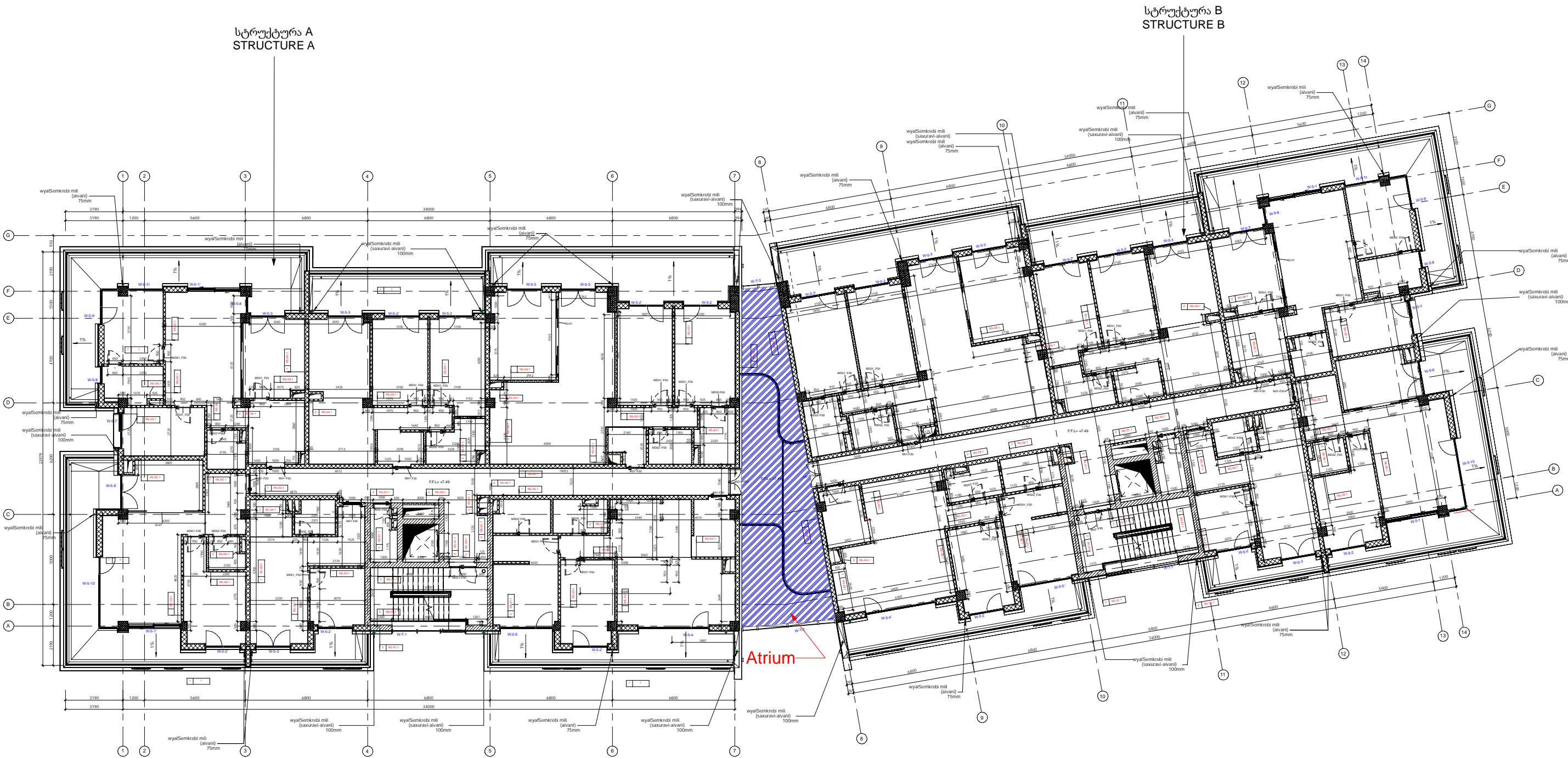
სტრუქტურა A STRUCTURE A