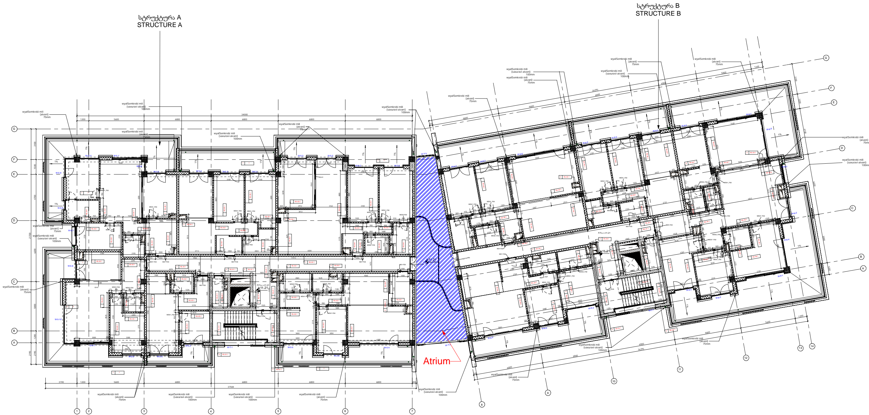
სტრუქტურა A STRUCTURE A