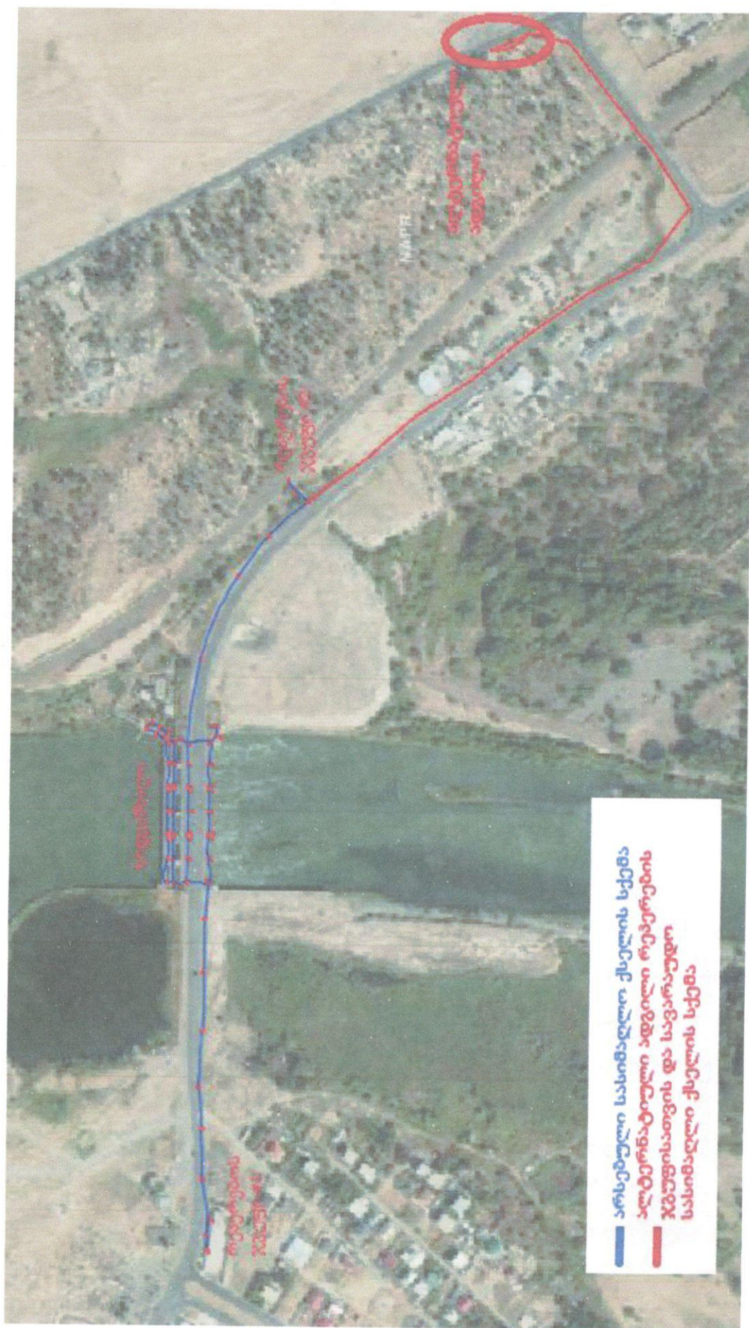
ნახაზი 5. რუსთავეის ხიდკაშხლის სასიმალო ქსელის არსებული ქსელის სქემა და პლანური ადგილი რეკონსტრუქციის და საგარეო სასიმალო ქსელის სქემა