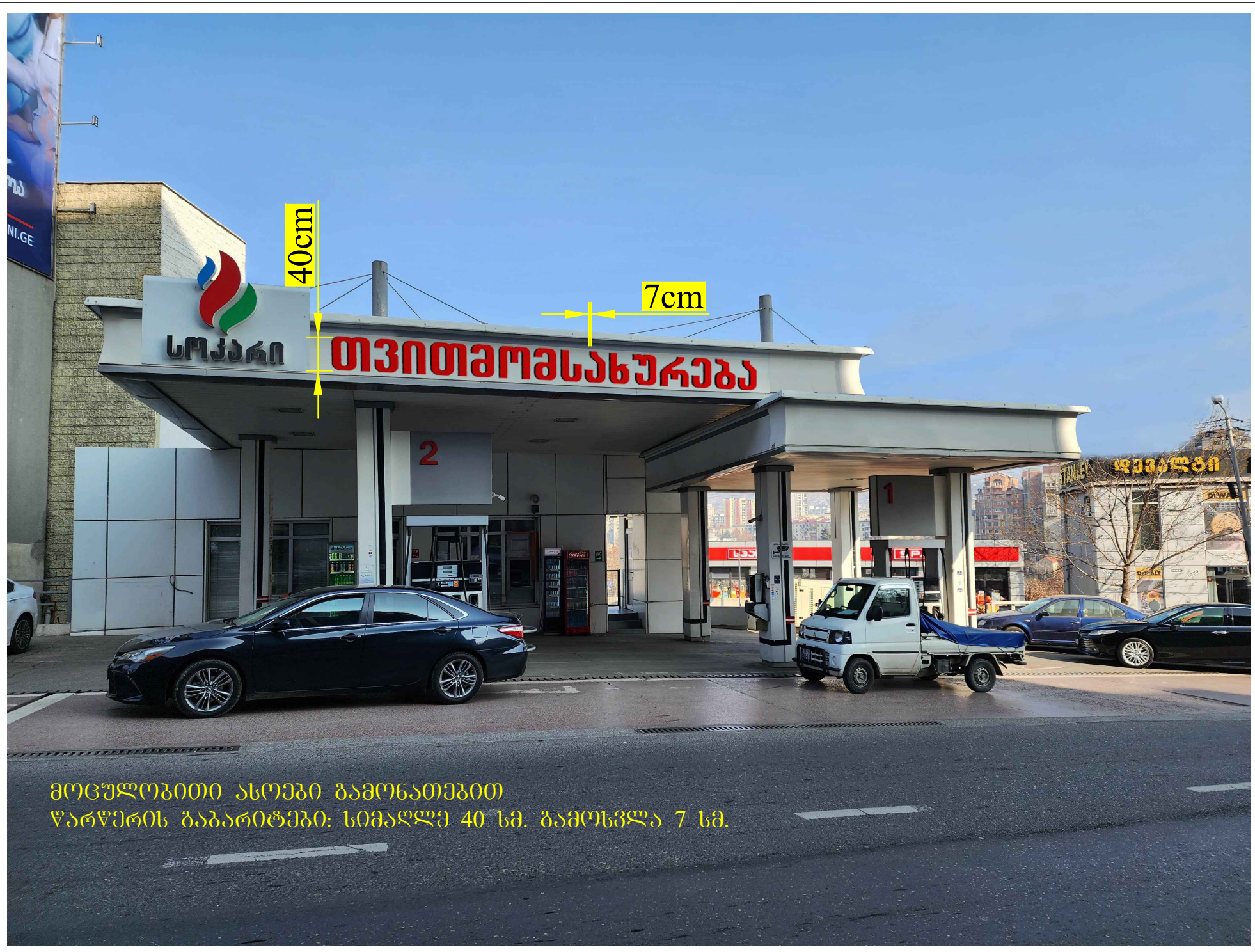
მონტაჟითი ასოები გააოქათებით წარწერის გაბარიტები: სიმაღლე 40 სმ. გაოქვლა 7 სმ.