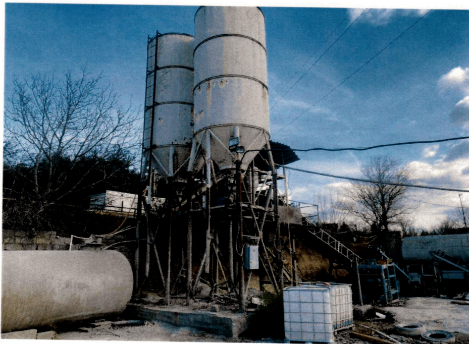
ცემენტის მიმწოდებელი დიამეტრი 220მმ. სიგრძე 4 მ.(შნევი) 2ცალი (ძრავ/რედუქტორი 5.5