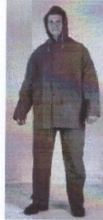
Рисунок 4: б) спецодежда на прорезиненной основе

Спецодежда на прорезиненной основе изготавливаются в соответствии с ГОСТ 12.4.134. спецодежда на прорезиненной основе состоит из куртки с капюшоном и полукombineзона.