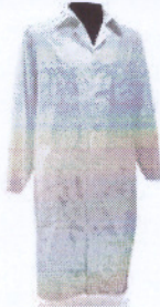
Рисунок 5 – вид халатов хлопчатобумажных

Халаты хлопчатобумажные должны отвечать требованиям ГОСТ Р 12.4.132, ГОСТ Р 12.4.131. Допустимые цвета халатов медицинских – белый, рукава длинные.