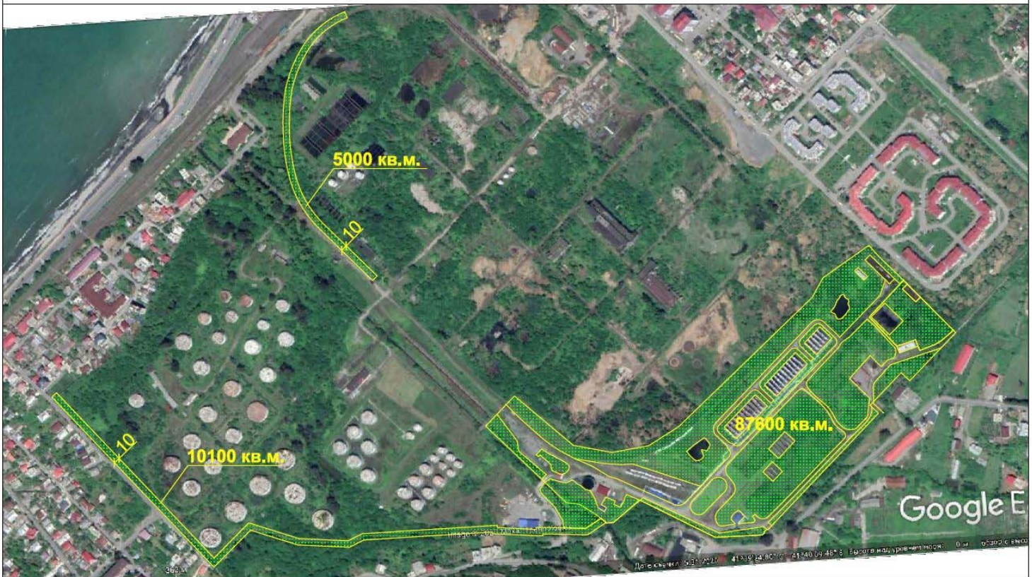
Покос травы и вырубка лесных деревьев на территории Станции приема и перевалки СУГ План М 1:4000

Подрядчик должен производит работы в соответствии календарного графика.