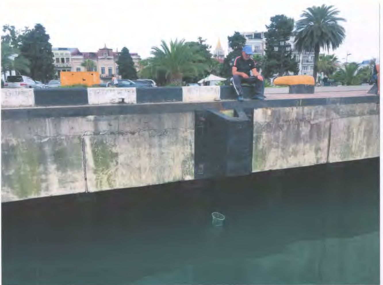
npuzan N/10 SXP-600 L=1000