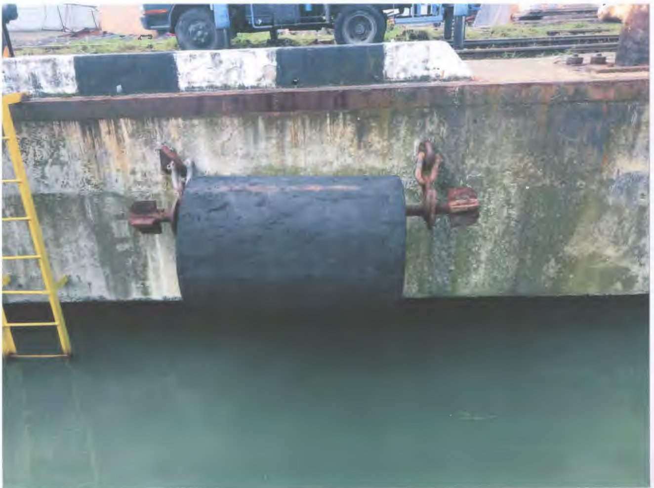
1000x500x1500 резиновый цилиндр