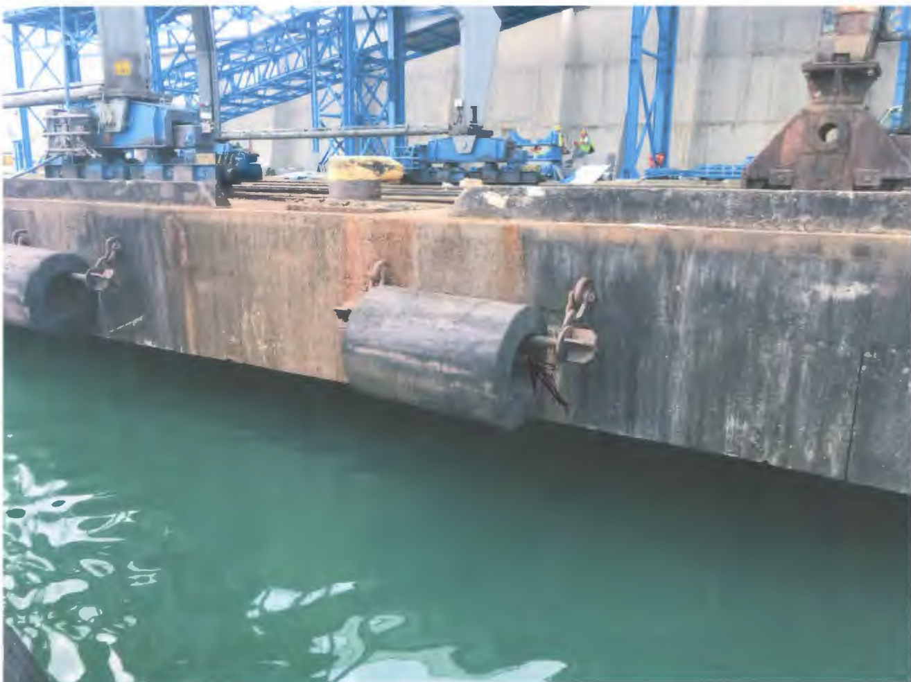
4000 x 500 x 1500 резиновой цилиндр