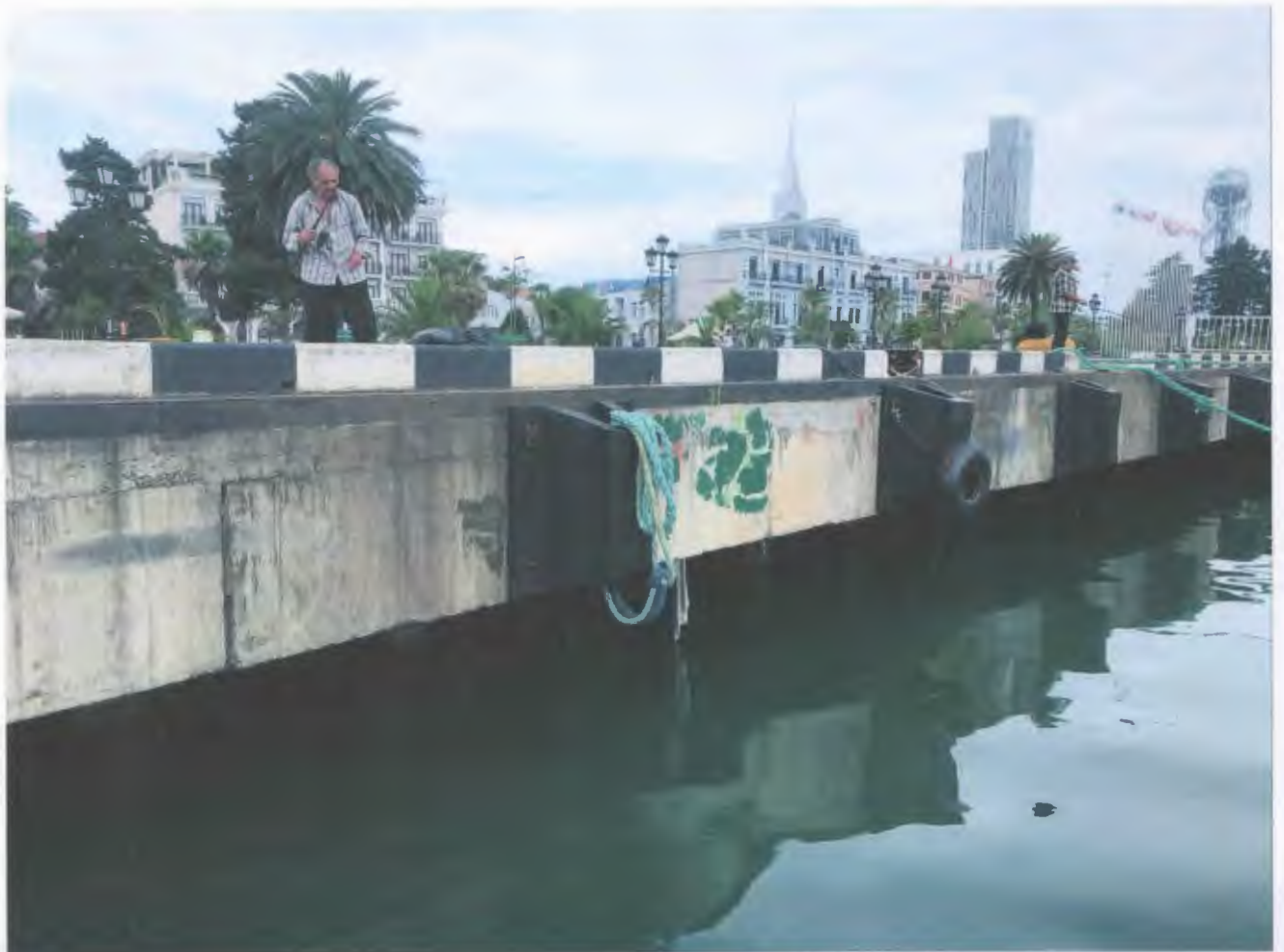
mpuran N10 SXP-600 L1000